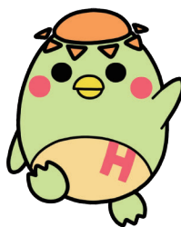
生徒作 学園公式キャラクター 「日和(ひよ)かっぱ」