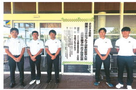
ゴルフ部 関東高等学校ゴルフ選手権大会