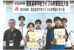
ライフル射撃部 関東高等学校ライフル射撃競技大会

特進勉強合宿(トーセイホテル&セミナー幕張) …… 7月31日(月)～8月2日(水)