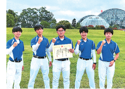
アーチェリー部 関東高等学校アーチェリー大会