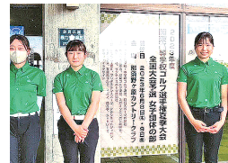
ゴルフ部 関東高等学校ゴルフ選手権大会