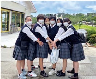
▲校外学習(マザー牧場)