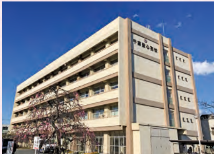
千葉聖心高等学校(全日制普通科女子)