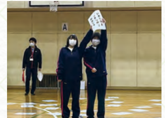
▲学年行事 (百人一首大会1年)