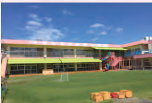
千葉女子専門学校附属聖心こども園