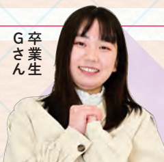
令和4年度卒業 淑徳大学進学

志望大学に進学できたのは、先生方が時間を作って模擬面接をたり相談に乗ってくれたおかげです。大学では、保育のことはも53人のこと、障害を持つ子どもたちを支援するために、子どもの福祉と発達などについても詳しく学びたいと思っています。将来は、子どもたちの個性を尊重して一緒に成長できるような保育士になりたいと思っています。