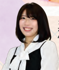
令和4年度卒業 千葉女子専門学校進学