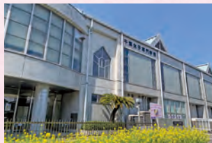
千葉女子専門学校(保育科)