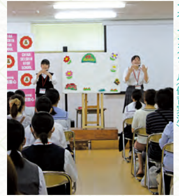
▲オープンスクール(保育実演)