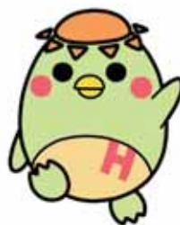
生徒作 学園公式キャラクター 「日和(ひよ)かつぱ」