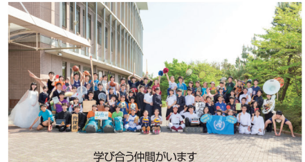
学び合う仲間がいます