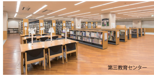
第三教育センター