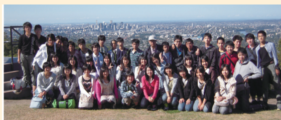
オーストラリア語学研修

文化祭「银杏祭」(中高合同9月)、体育祭(中学10月)、SPORTSDAY(高校6月)、文化的行事、オーストラリア研修・シンガポール高校研修(高一希望制)など文化祭実行委員会中高合同企画のひとつ「クラシックコンクール」は、ピアノ・バイオリン・フルートなど多彩でレベルの高い演奏で、毎年好評を博しています。